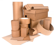
Cajas de Cartón NO CAJAS DE COMIDA CONGELADA