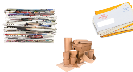
Periódico | Revistas | Papel de Oficina Cajas de Cartón