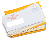
Correo y Revistas

En el Condado de Eagle el 81% de tu desecho puede ser desviado del basurero mediante el reciclaje y el compostaje!