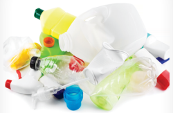
Botellas y Botes de Plástico CON TAPAS PUESTAS