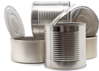
Latas REMOVER ETIQUETAS SI ES POSIBLE