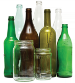
Botes y Botellas de Vidrio SIN TAPAS