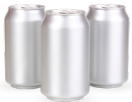
Latas de Aluminio REMOVER CALCOMANÍAS Y ETIQUETAS, NO APLASTAR