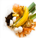
Todo los desechos de comida NO CALCOMANIAS O EL ENVASE

Si tienes recolección de compostaje en tu casa o usas uno de los botes en el centro de reciclaje