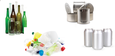
Vidrio | Aluminio | Latas | Plástico

Cartón solo puede ser reciclado en los sitios de reciclaje y tiene su propio bote.