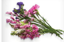
Flores y plantas muertas